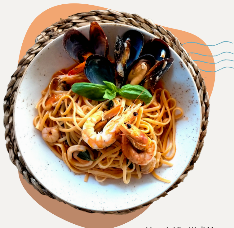
Linguini Frutti di Mare

Make your pasta dish more delicious by adding a Burrata for only €4.50!