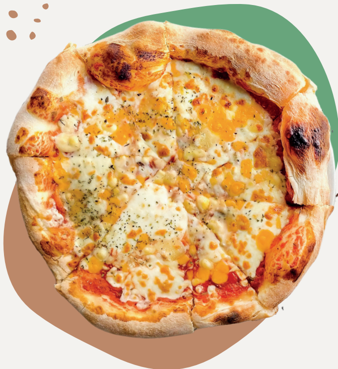
5 Quesos. 5 Cheeses