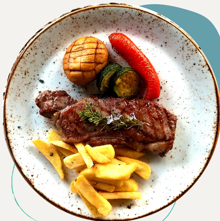
Entrecote gallego al Grill. Grilled entrecote

Entrecote gallego al Grill €24,90 Acompañado de patatas fritas, verduras y salsa de pimienta verde. Grilled entrecote served with chips, vegetables and green pepper sauce.