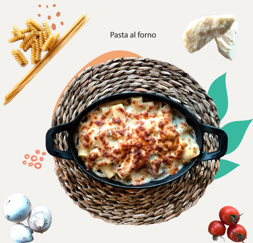
Pasta al forno

Stuffed with truffle and ricotta in parmesan cream.