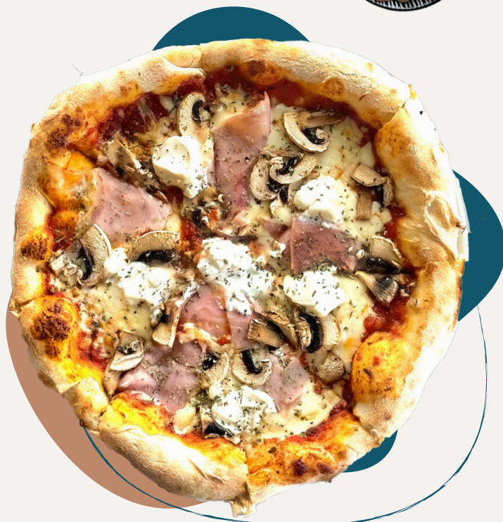
Prosciutto Funghi e Mascarpone